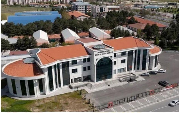
MURAT KANTARCI BİLİM VE SANAT MERKEZİ